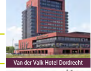
Van der Valk Hotel Dordrecht