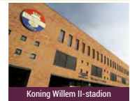
Koning Willem II-stadion

Nadere informatie: Tel. (013) 463 55 99, e-mail: mail@kantoormrvanzijl.nl , internet: www.kantoormrvanzijl.nl .