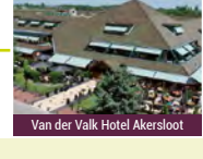
Van der Valk Hotel Akersloot