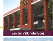
van der Valk hotel Goes