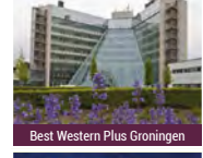
Best Western Plus Groningen